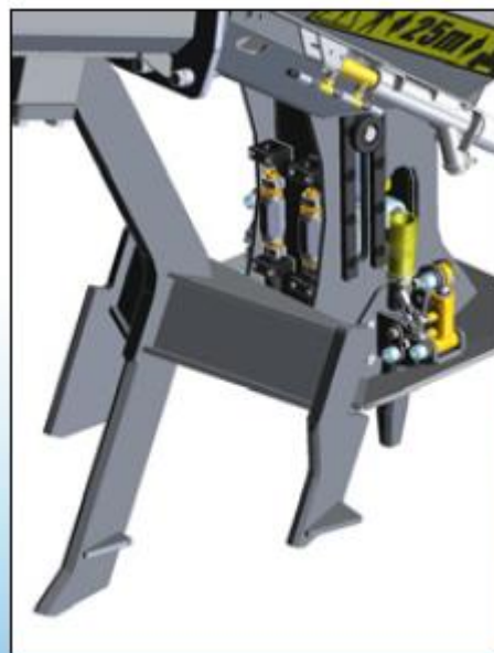
Herramienta de subsolado para preparación del suelo