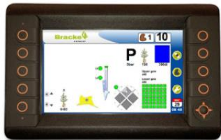
Todas las funciones se controlan fácilmente con el ordenador del sistema desde la cabina del operador.