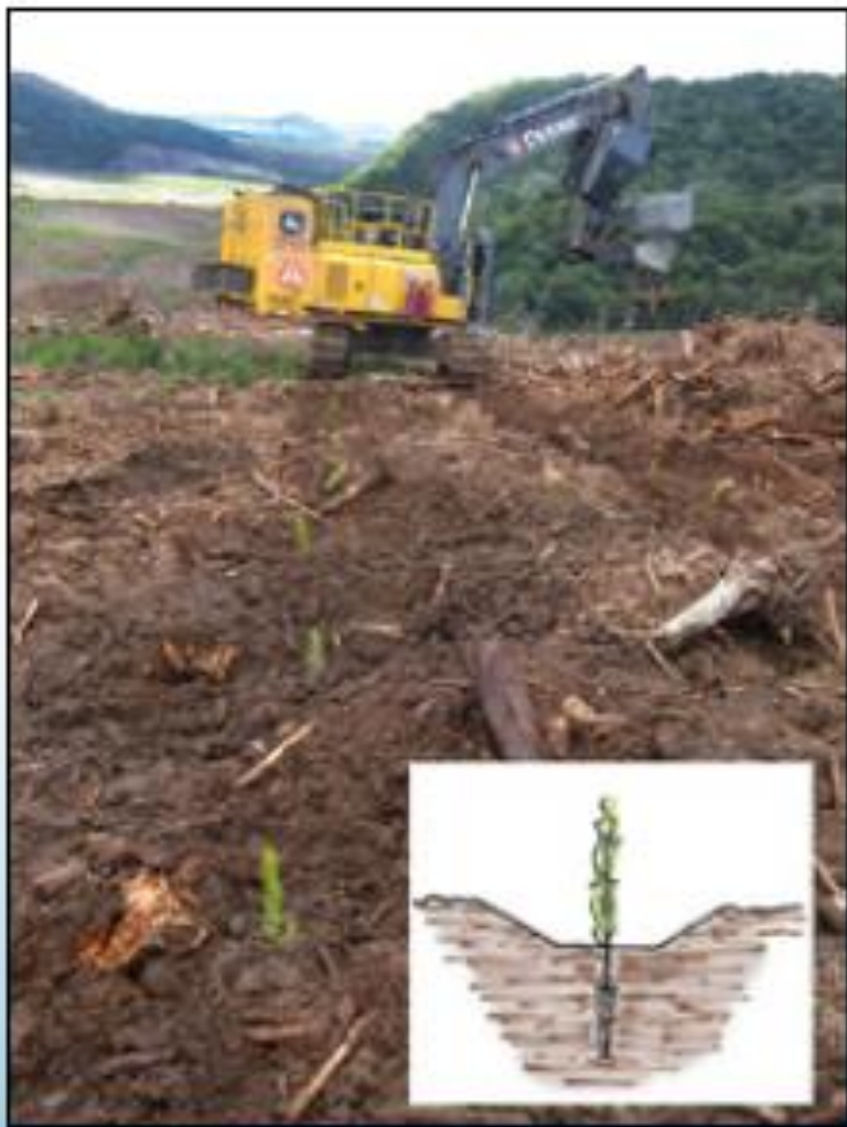
Bracke P12.a hace un punto de plantación bajo.