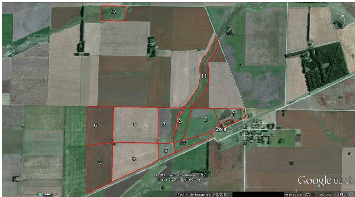
Figura III.1.4: Plano de un establecimiento mixto familiar de la región pampeana argentina, caso MF2.

Instalaciones: Casa principal, galpón, bebederos, molinos.