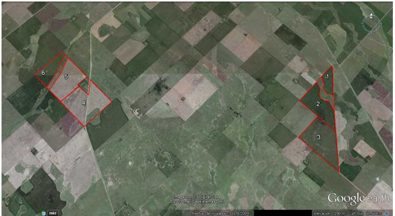
Figura III.1.13: Plano de un establecimiento agrícola empresarial de la región pampeana argentina, caso AE1.

En la figura III.1.13 puede observarse el plano del establecimiento con la distribución de las parcelas.