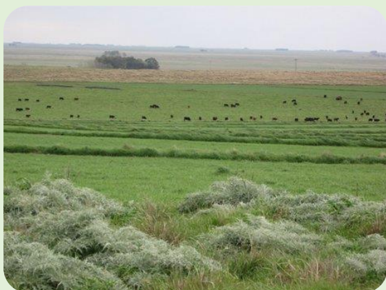
Figura 1. Paisaje la Aurora

El establecimiento “La Aurora” se encuentra al sudeste de la provincia de Buenos Aires a 400 Km. de la capital Federal de la República Argentina, en una zona de producción mixta de ganadería y agricultura. Es de tipo familiar, con 650 Has, de las cuales 300 son de suelo agrícola, 186 has de suelos bajos y 152 has de cerros con piedra. Es una zona de clima templado, con un régimen de lluvia promedio de 800 mm y con probabilidades de heladas de mayo a noviembre.