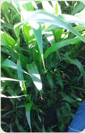
Figura 5. Sorgo con vicia

El enfoque y marco teórico de la Agroecología permitió entender los principios ecológicos generales presentes en el establecimiento y, adecuándolos a las características locales (sociocultural y ambiental), generar las estrategias necesarias para encontrar las soluciones a las inquietudes planteadas por el productor.