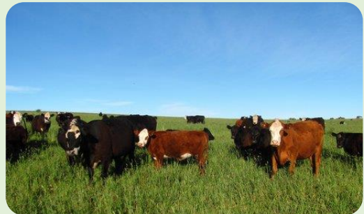
Figura 6. Animales

Esta experiencia sirvió para desarrollar y validar los conceptos teóricos y experiencias realizadas en ámbitos de investigación científica como la Facultad de Agronomía de la UNLP, la chacra Experimental de Barrow. Ha servido también como un faro agroecológico visitado en el último año por más de 300 personas entre ellos estudiantes universitarios, profesionales y productores. Fue fundamentalmente un motivador para grupos de productores que tomaron como referencia estas experiencias para sus establecimientos y para municipios que acompañaron la iniciativa de realizar experiencias agroecológicas que posibiliten la disminución en el impacto ambiental de sus comunidades como el Municipio de Guamini, provincia de Buenos Aires. Y, por sobre todo, demostró que es posible aplicar los conceptos y principios de la Agroecología a sistemas extensivos de clima templado.