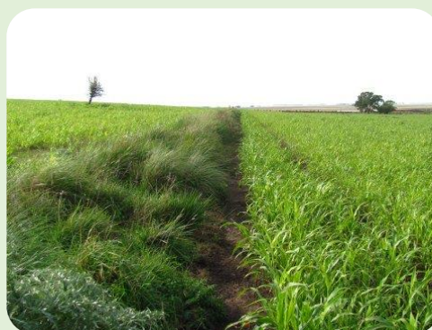
Figura 2. Corredor Biológico

Desde el año 1997, en el establecimiento La Aurora se comienza a trabajar con un enfoque agroecológico, con el fin de satisfacer una serie de objetivos planteados por el propio productor: a) Tener estabilidad productiva y económica: “tranquilidad” (disminuir los sobresaltos), b) Bajar los costos, disminuir el uso de insumos, c) Evitar el uso y la manipulación de productos tóxicos, por el riesgo que tienen tanto para su familia y la gente que trabaja con él, como para el ambiente d) Estabilizar la producción, lograr un ingreso que le permita mantener el nivel de vida de su familia y empleado, e) Mantener el campo igual o mejor de lo que le dejaron sus padres.