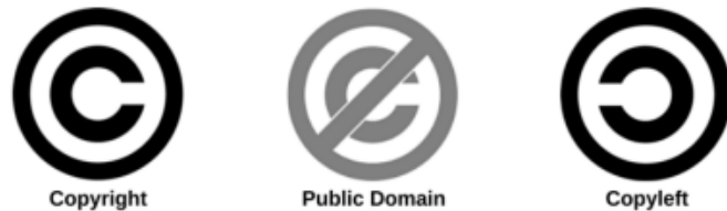
Imagen 3: derechos de autor

Vinculado con lo expresado anteriormente podemos decir que el DERECHO DE AUTOR es el conjunto de normas jurídicas que garantizan la PROPIEDAD INTELECTUAL -tanto patrimonial como moral- que la legislación otorga al creador de una obra de cualquier tipo (sobre la misma o parte de ella) esté ya publicada o aún permanezca como inédita. Esta legislación, también conocida con el término anglosajón COPYRIGHT es relativamente moderna en Occidente (siglo XVIII) y se reconoce por el uso del símbolo ©. Es muy importante señalar que para generar los derechos de autor no se exige ninguna inscripción en un registro, sino que nacen con la creación de la obra en sí. Por eso, si NO se realiza un registro de una obra literaria, científica, artística, etc. bajo alguna OTRA licencia alternativa, SIEMPRE quedará bajo la regulación del tipo de licencia Copyright. Otro aspecto importante para recordar es que no es el soporte el que marca la situación legal de la obra sino la obra en sí: no se modifica la situación legal si la imagen o el texto lo encontramos en la web de un organismo público o gobierno o Universidad.