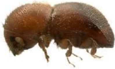
Xylosandrus crassiusculus (Hulcr)