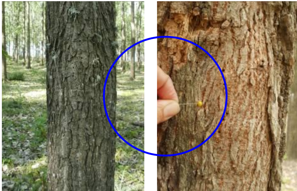
Ejemplar de Populus sp. con múltiples orificios dispuestos linealmente sobre las hendiduras de la corteza (Acosta) (izq.). Detalle de los orificios en Acer negundo L. (Acosta) (der)