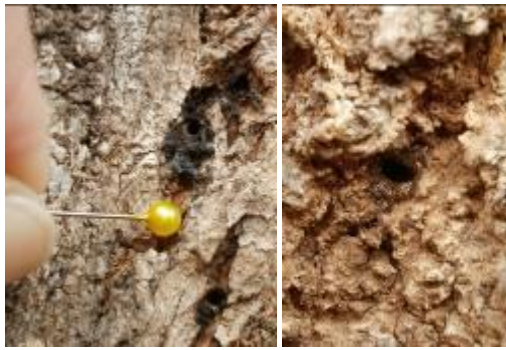
Orificio de entrada en A. negundo L. más viejos (der.) y reciente (izq.) (Acosta)