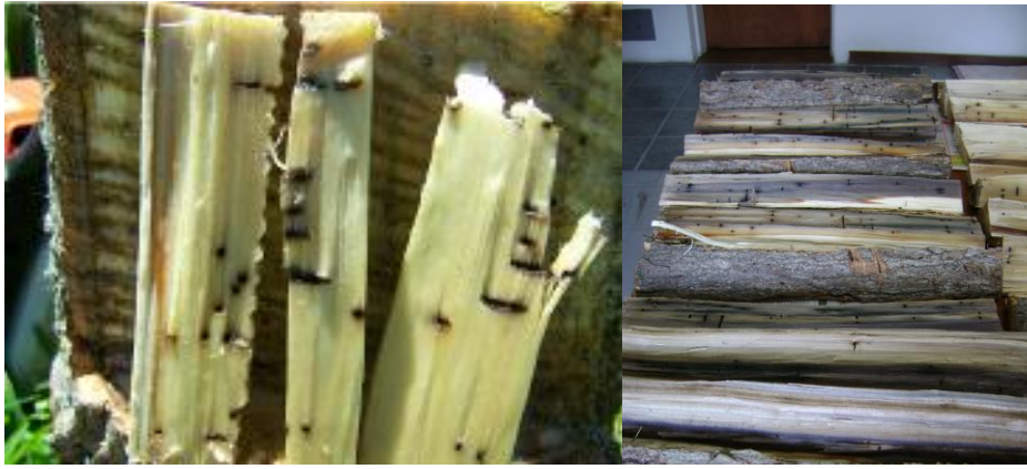
Galerías tapizadas con micelio oscuro (Landi) (izq). Manchado y múltiples galerías que deprecian el valor de la madera (Landi) (der)