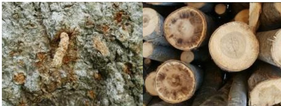
Orificio con el "tubito" de aserrín (Acosta)(izq.) Rollizos manchados (Acosta) (der)