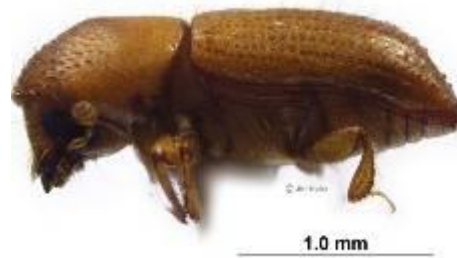
Xyleborus sp. (Hulcr)