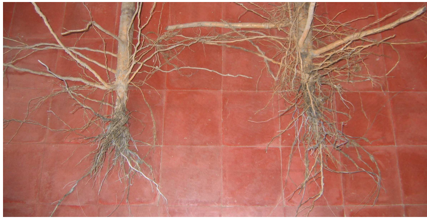
Figura 3: Efecto de la roya sobre el desarrollo de raíces. Izq. Plantas afectadas por roya. Der. Plantas sanas.

La cantidad de nitrógeno por gramo de materia seca fue variable dentro de cada uno de los tratamientos, pero no resultó ser significativamente diferente entre tratamientos, alcanzando valores de 1,47 y 1,44 % para raíces de plantas sanas y enfermas respectivamente.