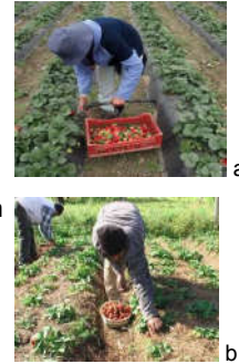
Figura 6. Cosecha.

Se puede esperar un rendimiento de 500 g a 1 kg o más por planta según los cuidados que se les brinde.