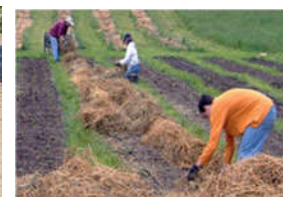
Figura 4. Mulching material vegetal.