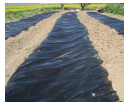
Figura 3. Mulching plástico.

Esta práctica impide que salgan las malezas, mantiene en forma uniforme la humedad del suelo, aísla y evita podredumbres por el ataque de hongos, ya que los frutos no están en contacto directo con el suelo.