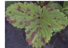
Figura 8. Viruela.

Virósicas: producen pérdida del vigor de la planta, moteado verde claro en hojas, manchas o bandas cloróticas a lo largo de las nervaduras, enanismo, deformación de las hojas. La mayoría son transmitidas por pulgones y trips.