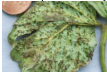
Figura 9. Mancha angular de la hoja.