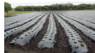
Figura 2. Sistema convencional de plantación.

Los suelos arenosos permiten un mejor desarrollo de esta especie.