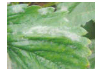
Figura 7. Oidio.

Fúngicas. “Oidio”: produce manchas blanquecinas en el envés de las hojas, que deforman y enrulan las hojas y puede afectar toda la planta (Figura 7). “Viruela”: manchas circulares violáceas en ambas caras de la hoja. Luego el centro se vuelve blanco, mancha tipo “ojo de pájaro” (Figura 8)