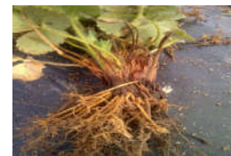
Daño por nematodos

Consultar a los profesionales de la zona sobre prevención y control de enfermedades e insectos plagas