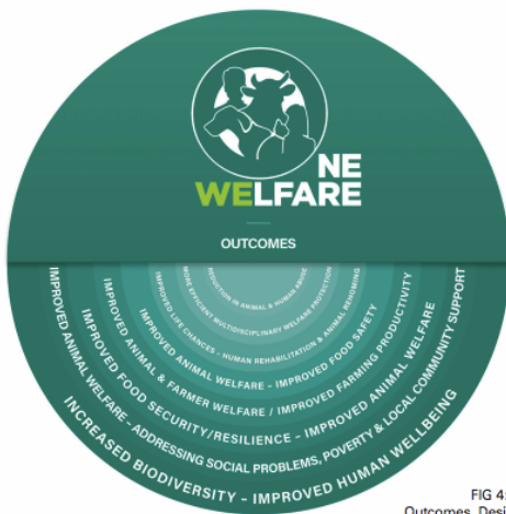
FIG 4: One Welfare Outcomes. Design by R. Held

animales y medioambientales - ayudará a describir el contexto, profundizando en nuestro entendimiento de los factores involucrados y crear un planteamiento global orientado a solucionar temas de salud y bienestar (Jordan y Lem 2014). Integrar Un Solo Bienestar con Una Salud abrirá puertas a más enfoques globales que cubrirán todos los aspectos de los temas considerados, y no solamente partes de la ecuación (Fig. 3).