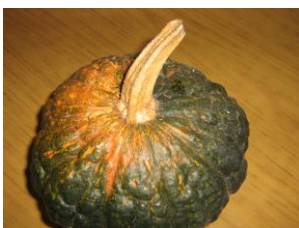
Zapallo Hokaido (Tetsukabuto)