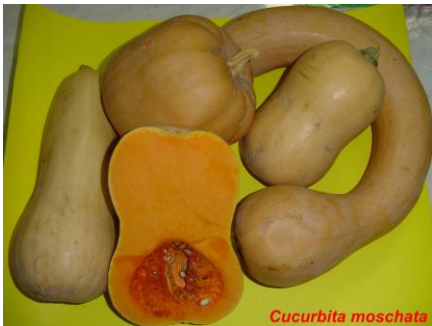
Cucurbita moschata (Anco)

Zapallito redondo de tronco ( Cucurbita maxima var zapallito ): Es una planta de porte arbustivo, de mata compacta desprovista de guías, con los frutos verdes, pequeños, deprimidos, que se consumen al estado tierno, inmaduro. Existen variedades de polinización abierta e híbridos.