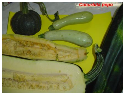
Cucurbita pepo (zucchini y angola)