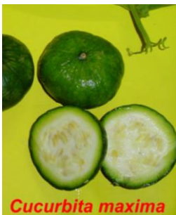
Cucurbita maxima (de tronco y plomo)