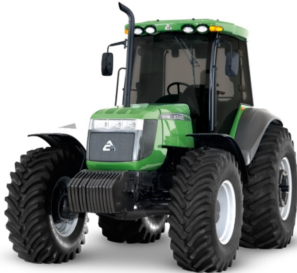
TRACTOR AGRALE BX 6180