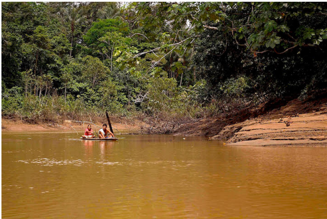
Familia kichwa navegando por el río Tiputini en canoas construidas a mano por los indígenas.