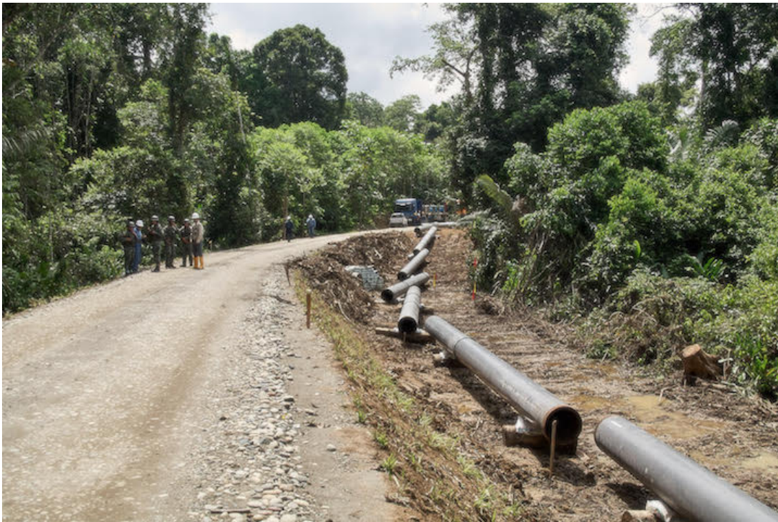
Miembros del ejército ecuatoriano y trabajadores de Petroamazonas vigilan la carretera que se construye al interior del Parque Nacional Yasuní y que conectará el campo Tambococha con el puerto Miranda.