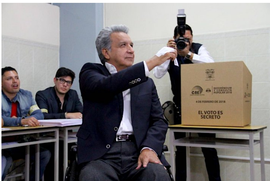
El presidente Lenin Moreno, quien planteó la convocaría a Referéndum y Consulta popular, votó en la Universidad Equinoccial de Quito.

bloques 31 y 43, mejor conocido como ITT por estar conformado por los campos Ishpingo, Tambococha y Tiputini. Y por primera vez tienen una importante arma para luchar contra un proceso extractivo que empezó hace poco más de cuatro años, cuando en octubre de 2013 la Asamblea oficialista acogió el pedido del entonces presidente Rafael Correa y dio paso al aprovechamiento hidrocarburífero de dichos bloques, que sobrepasan la Zona Intangible Tagaeri-Taromenane (ZITT), creada para proteger a los pueblos indígenas en aislamiento voluntario. El arma se llama 'voluntad popular' y se respalda en 6,1 millones de votos de ecuatorianos (con el 98,5 % de escrutinio) que dijeron sí a la séptima pregunta del referéndum y consulta popular que convocó el presidente Lenin Moreno para tramitar cambios a nivel económico, político, judicial y medioambiental. Un proceso electoral que además eliminó la reelección indefinida en Ecuador y con ello, tiró por el piso las intenciones del expresidente Rafael Correa de regresar al poder.