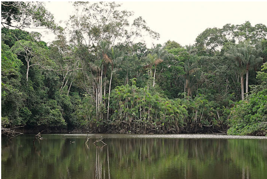
Paisaje de una laguna al interior del Yasuní.

Mongabay Latam realizó varios pedidos de información a los ministerios de Hidrocarburos, Ambiente y Justicia, este último a cargo de la ejecución de las medidas cautelares dictadas por la Corte Interamericana de Derechos Humanos (CIDH) a favor de los pueblos aislados. Esto para conocer las áreas actuales de explotación en los bloques 31 y 43 ITT, los planes de manejo ambiental que se ejecutan para reducir los impactos y las propuestas para la aplicación de la Zona Intangible Tagaeri Taromenane. Pero, aunque hubo la confirmación de la recepción del pedido, no hubo respuestas hasta el cierre de esta edición. Sin embargo en una publicación