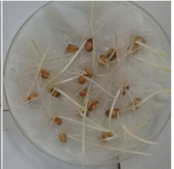
Trigo nuevo (+ + +)