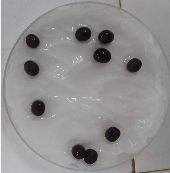
Semillas sin escarificar (- - -)