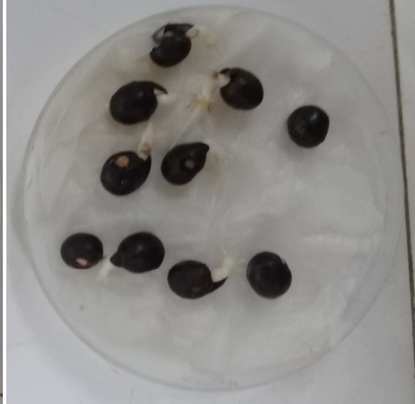
Semillas escarificadas (+ + +)